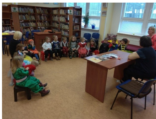
Návštěva školky v knihovně

Upoutávky na veškerou činnost knihovny vkládáme na knihovnický facebook a na facebook města.